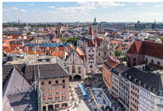
Muster-Impressionen zur Lage

Der Stadtteil verfügt über eine gute Infrastruktur und ein attraktives Freizeitangebot, wie beispielsweise das nahe gelegene Schwimmbad, ein 18-Loch Golfplatz und auch das beliebte Kulturzentrum mit seinen vielen Veranstaltungen. Neben verschiedenen Schulen sind auch mehrere Kinderbetreuungseinrichtungen vorhanden. Die täglichen Einkäufe können in den wenige Minuten entfernten Supermärkten erledigt werden. Verschiedene Allgemein- und Fachärzte stellen eine gute medizinische Versorgung sicher.